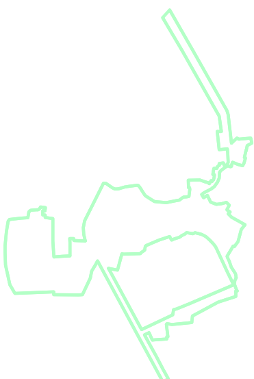
NUOVO PERIMETRO CENTRO ABITATO